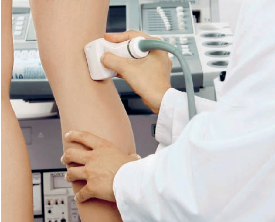
Schmerzfreie Untersuchung mittels Ultraschall.

Es beginnt meist mit müden, schweren Beinen. Die Füße schwellen an, die Schuhe werden zu eng. Nächtliche Wadenkrämpfe, unangenehmes Kribbeln und ziehende Schmerzen in den Beinen bereiten Probleme. Es sind die typischen Anfangssymptome einer Venenerkrankung mit ernstzunehmenden Warnsignalen, denn sind die Venen erst einmal geschädigt, beginnt ein Teufelskreis.