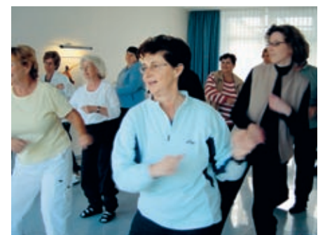
TanzVenenGymnastik® in der Artemed-Fachklinik Bad Oeynhausen.